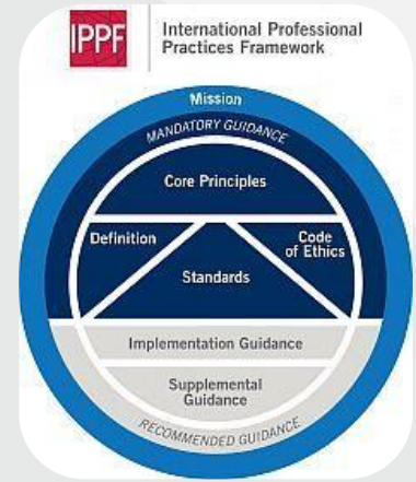
© IIA – Institute of Internal Auditors