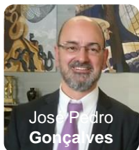
Partner e Head of Consulting da RSM

O Observatório dos Objetivos de Desenvolvimento Sustentável (ODS), nas empresas portuguesas, numa iniciativa da Universidade Católica de Lisboa, - elaborou uma compilação dos resultados apurados para o Relatório do Ano 1 do Observatório dos ODS nas empresas portuguesas e apresentou uma síntese destes dados num booklet intitulado “ Como estão as PMES Portuguesas a incorporar a Sustentabilidade nas suas Estratégias e Operações? ”. (Ler mais)